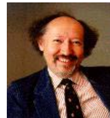
Крис Дейт (р. 1941)